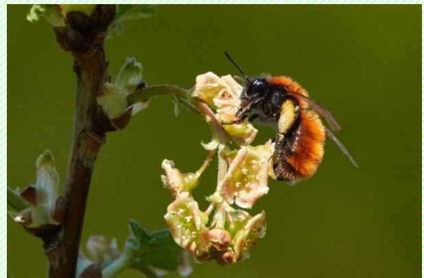
Figuur 4 Vosje op Zwarte bes