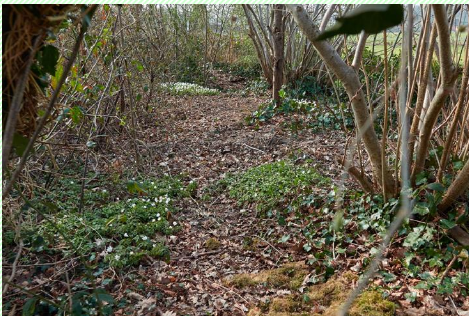
Oude bosgroeiplaats in Vorden

https://gelderland.stateninformatie.nl/vergadering/1427498/Cluster%20Natuur%2C%20Landbouw%20en%20Landelijk%20gebied