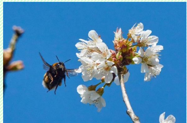
Figuur 3 Aardhommel op Wilde kers