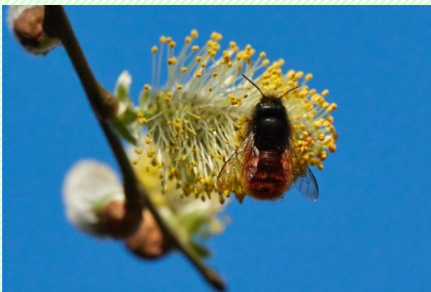
Figuur 2 Gehoornde metselbij op Boswilg