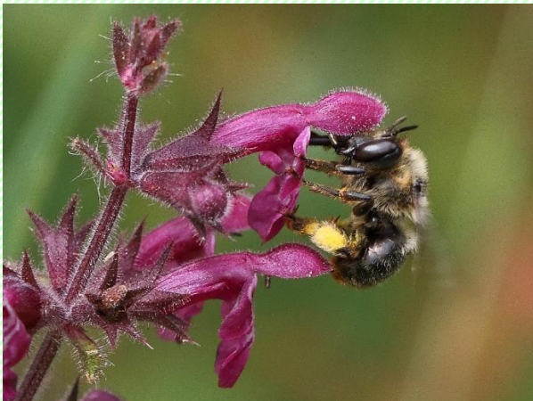
Figuur 1 Andoorn bij op Bosandoorn

https://vng.nl/nieuws/impact-europese-natuurherstelverordening-voor-gemeenten