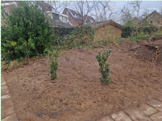
situatie december 2025

Helaas illustreert dit voorval treffend hoe weinig aandacht er bij de gemeente is voor natuurbescherming. De beleidsmensen zijn van goede wil, maar ecologisch inzicht is bij de uitvoerenden te weinig. Het gemis van een gemeentelijk ecooloog wordt zo wel pijnlijk zichtbaar. Wij zullen ervoor pleiten dat alle oude bosgroeiplaatsen een natuurbestemmingsstatus krijgen en dat voor die oude bosgroeiplaatsen die in eigendom van de gemeente zijn, een passend beheerplan wordt gemaakt.